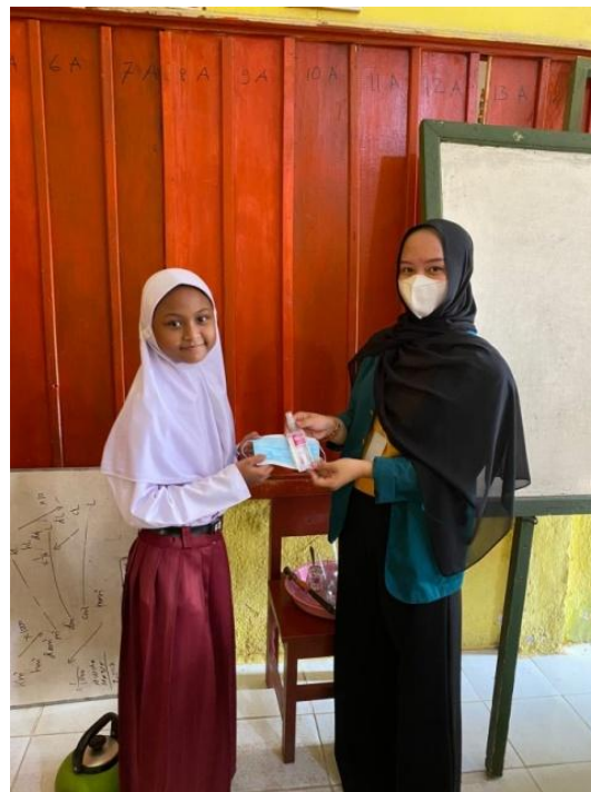
Gambar 2. Pembagian Masker dan Handsanitizer

Hasil yang didapat setelah melakukan kegiatan sosialisasi dengan cara pemberian materi dan penjelasan literasi media dan berita hoax ini adalah :