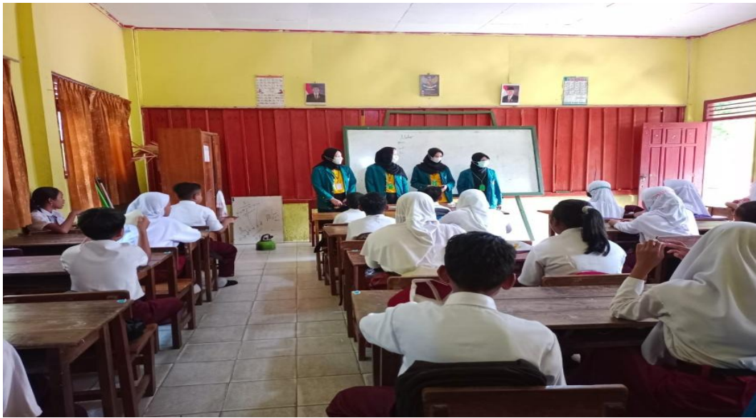
Gambar 1. Penyampaian Materi Literasi Media dan Berita Hoax