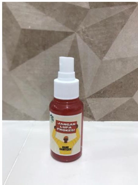
Gambar 4. Hasil Hand sanitizer dari daun sirih dan jeruk nipis

Penggunaan daun sirih dan buah jeruk nipis sebagai hand sanitizer sangat penting untuk dilakukan karena daun sirih dan buah jeruk nipis sendiri mudah ditemukan dan memiliki banyak manfaat. Pengetahuan masyarakat tentang pembuatan hand sanitizer dengan menggunakan daun sirih dan jeruk nipis sama sekali belum pernah dilaksanakan atau masih sangat terbatas. Kegiatan monitoring ini dapat memberikan solusi pembuatan hand sanitizer dengan harga yang sangat terjangkau dan bahan yang mudah didapat serta