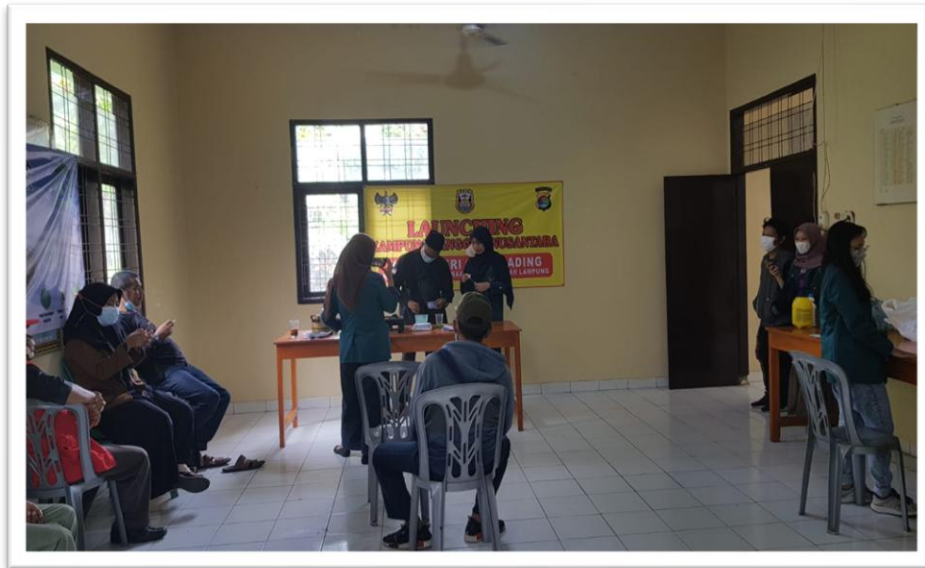
Gambar 3. Kegiatan Monitoring pembuatan hand sanitizer oleh masyarakat Negeri Olok Gading