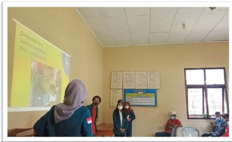
Gambar 2. Pelaksanaan kegiatan sosialisasi dengan media video

Kegiatan selanjutnya yaitu monitoring yang dihadiri oleh beberapa masyarakat yang sebelumnya mengikuti kegiatan pertama pada 18 Agustus 2021. Kegiatan ini bertujuan untuk mengetahui parameter keberhasilan dalam kegiatan ini dengan melihat pemahaman dari pembuatan hand sanitizer yang telah disosialisasikan kepada masyarakat Negeri Olok Gading. Pada kegiatan ini penerapan PPKM Level 4 di Bandar Lampung masih berlangsung sehingga hanya diwakili beberapa perwakilan masyarakat seperti pelaksanaan pada kegiatan yang pertama. Beberapa masyarakat diminta untuk mempraktekkan pembuatan hand sanitizer (Gambar 3) seperti video yang sudah dicontohkan pada kegiatan pertama. Respon masyarakat terhadap kegiatan ini terlihat sangat antusias mengingat hand sanitizer sering digunakan dalam keseharian masyarakat baik di rumah ataupun di luar rumah. Masyarakat yang sudah mempraktekkan setiap langkah-langkah pembuatan hand sanitizer dari daun sirih ini diharapkan sudah memahami bagaimana proses tahapan dalam pembuatan hand sanitizer tersebut. Setelah rangkaian proses pembuatan hand sanitizer selesai maka masyarakat dapat merasakan hand sanitizer yang telah dibuat sehingga kegiatan ini benar-benar dirasakan manfaatnya. Selain itu, masyarakat yang sudah paham dapat mempraktekkan langsung di rumah masing-masing. Hasil dari kegiatan ini yaitu hand sanitizer siap pakai yang berwarna sedikit kekuningan dan tentu saja beraroma jeruk nipis (Gambar 4).