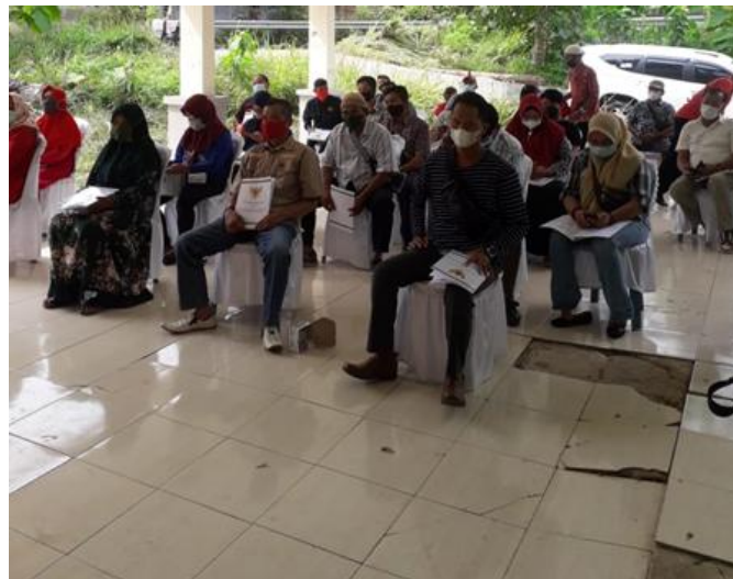
Gambar 1. Pembukaan kegiatan sosialisasi pembuatan hand sanitizer

Kegiatan sosialisasi pembuatan hand sanitizer dimulai dari acara pembukaan kegiatan yang dihadiri oleh 15 masyarakat Negeri Olok Gading yang terdiri dari masyarakat sekitar dan ketua gugus tugas Covid-19 daerah setempat yang berlokasi di halaman aula Kelurahan Negeri Olok Gading (Gambar 1). Kegiatan ini diawali dengan penyuluhan tentang manfaat dan kandungan hand sanitizer berbahan dasar daun sirih dan jeruk nipis. Hal ini bertujuan agar masyarakat dapat mengetahui banyaknya manfaat menggunakan hand sanitizer dari daun sirih dan jeruk nipis, yang di mana dapat ditemui dalam kehidupan sehari-hari.