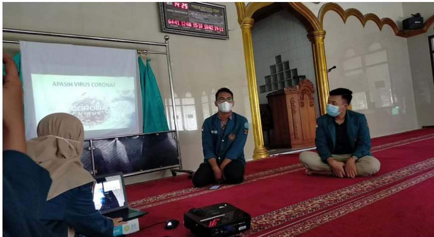
Gambar 4. Sosialisasi covid-19