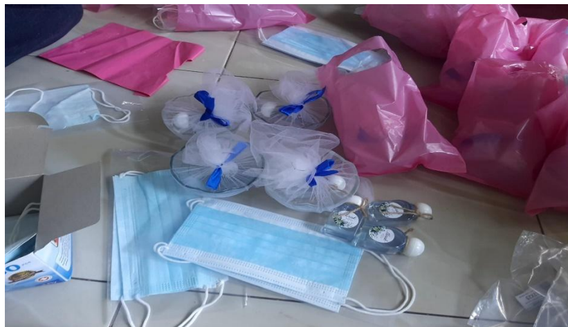
Gambar 2. Pembungkusan masker dan handsanitizer

September 2021 di Masjid Miftahul Huda Dusun 3 Desa Wayhuwi yang dihadiri oleh kelompok pengajian ibu-ibu dalam kegiatan pengajian rutin yang dilaksanakan setiap hari Jumat. Sebanyak 50 buah handsanitizer dan 100 masker medis dibagikan kepada ibu-ibu pengajian. Ibu-ibu yang datang ke masjid tanpa menggunakan masker diberikan himbauan langsung untuk menggunakan masker yang baru saja dibagikan oleh penulis. Selanjutnya ibu-ibu kelompok pengajian diarahkan untuk memasuki masjid dengan tetap menjaga jarak dan mematuhi protokol kesehatan. Sosialisasi Covid-19 dilaksanakan selama 3 jam dengan menggunakan pendekatan ceramah, diskusi, tanya jawab dan simulasi kasus dengan ilustrasi kepada ibu-ibu. Kegiatan ini diharapkan mampu meningkatkan pemahaman masyarakat mengenai Covid-19 serta meningkatkan kesadaran masyarakat terhadap pentingnya protokol kesehatan yang harus dilakukan ditengah pandemi.