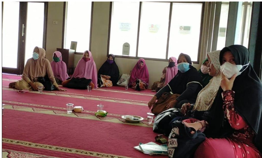
Gambar 5. Sosialisasi covid-19 ibu-ibu pengajian

Untuk mengetahui tingkat keberhasilan program kerja yang telah dilaksanakan berjalan dengan baik atau tidak maka diperlukan evaluasi baik dalam perencanaan dan pelaksanaan kegiatan. Evaluasi dilakukan dengan cara membandingkan perbedaan keadaan sebelum sosialisasi Covid-19 dilakukan dengan keadaan setelah sosialisasi Covid-19 dilakukan. Perbedaan tersebut dijelaskan pada tabel berikut: