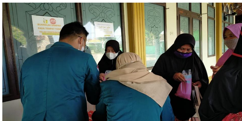
Gambar 3. Pembagian masker dan handsanitizer